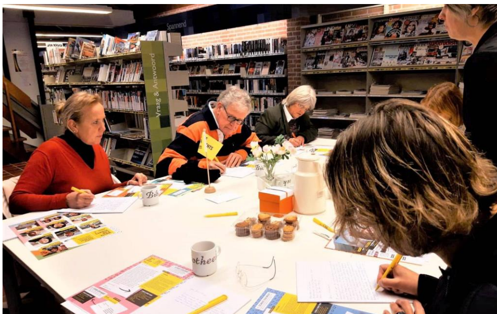
Foto: schrijfactie midden Drenthe 2023